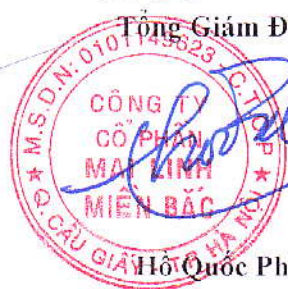
Hồ Quốc Phi