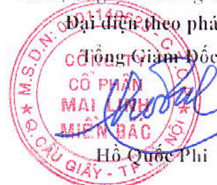
Hô Quốc Phi